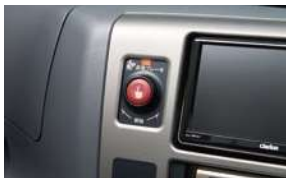
非常ブレーキスイッチ・・・運転席、客席(左右の最前列上部に設置)