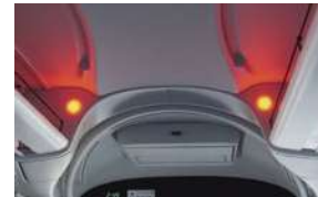
赤色フラッシャー・・・EDSSの作動を乗客に伝達