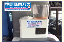
次亜塩素酸除菌水噴霧器