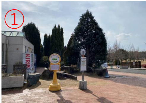
1, 二次元之森F停車場的免費接駁車站。