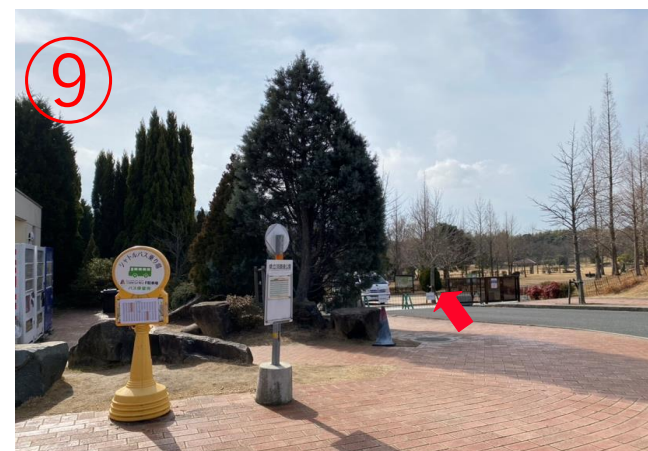
9, 二次元之森入口。※距离「哥斯拉拦截行动」最近