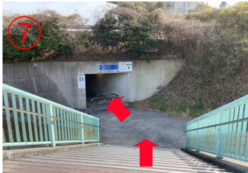
7, 下橋後，對面是隧道入口。