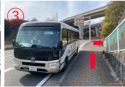
3, 到達淡路IC。*高速巴士的乘車地點在道路對面。