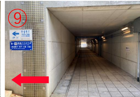
9, 步行約50m, 左右兩側是通往高速巴士乘車處的樓梯。