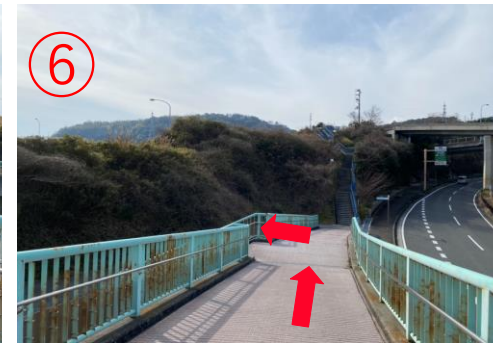
6, 從左側的樓梯下橋。