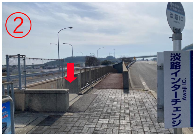
2, 車站附近有通往地下通道的樓梯。