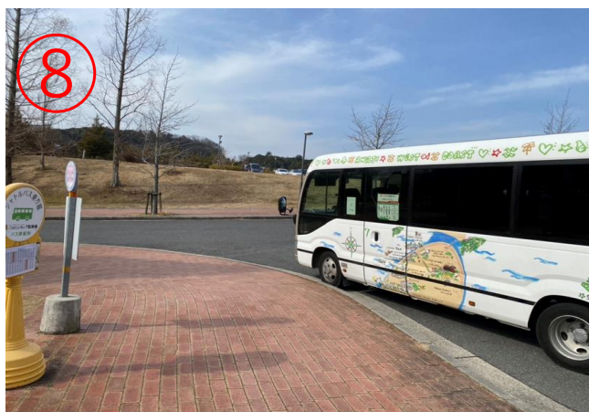
8, 到達二次元之森F停車場。※回程也在此處上車。