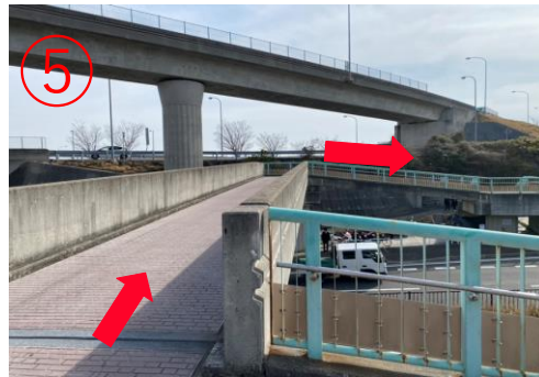
5, 沿著橋上的道路過橋。