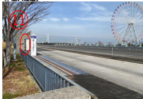
11, 樓梯上去後，就可以看見「淡路IC」巴士站。