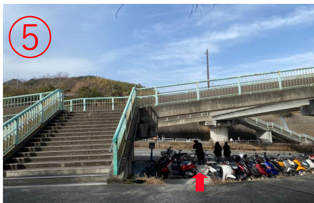
5, 隧道口附近有個小樓梯，下樓梯後在左側橋墩附近候車。