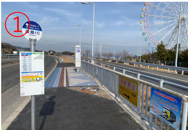
1, 從大阪/神戸方面駛來的高速巴士到達「淡路IC」站。