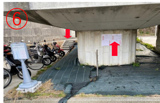
6, 橋墩上面貼有免費接駁車的發車時間表。