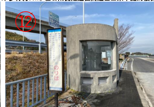
12, 到達「淡路IC」巴士站。(回程高速巴士的乘車處。)