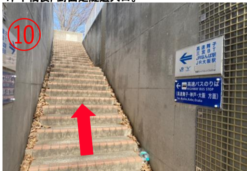
10, 從左手邊的樓梯上去。