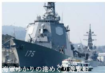
海軍ゆかりの港めぐり遊覧船